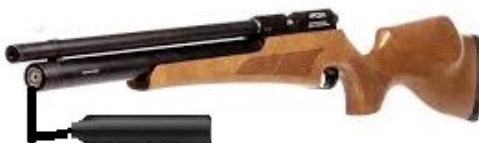
Figura 1 - AR-UR: Exemplo de garrafa solidária (buddy) anexada ao cilindro de ar.

ATENÇÃO: O alvo padrão e a distância adotada para a divisão AR-UR são os mesmos utilizados para as divisões Rimfire (50m).